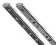
Canalizzazione aria Easy Air (da definire su richiesta)

Canaline diffusione aria laterali completamente personalizzabili, abbinabili a gruppi A/C della gamma Autoclima e non.