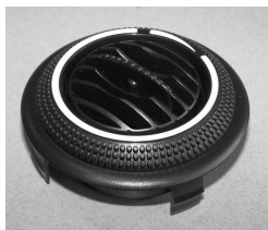
Bocchetta aria dm. 77.5 - nera